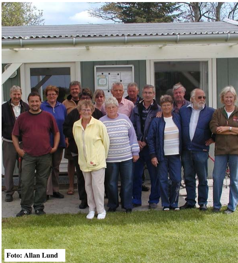
Socialdag den 12. maj