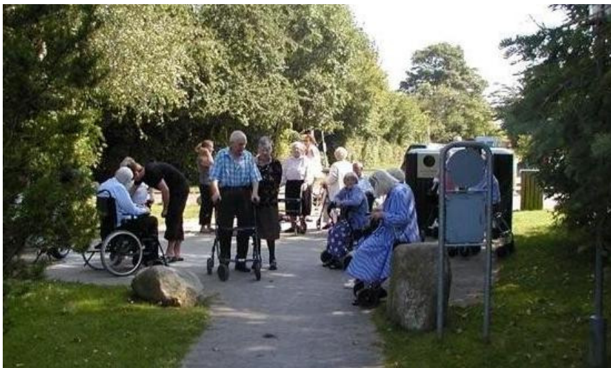
Nogle af Toftehavens beboere på besøg en flot solskinsdag i august 2008.