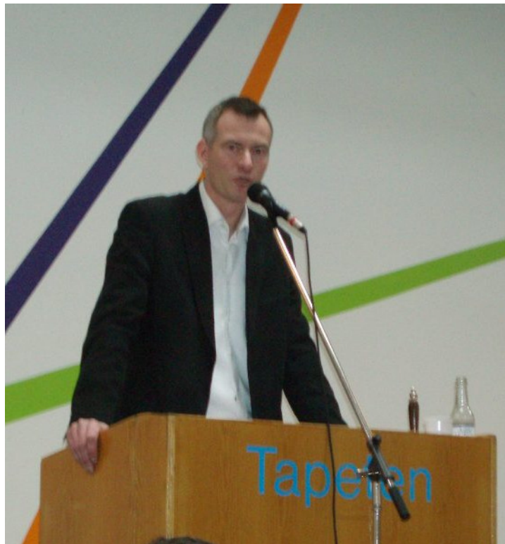
Formanden bød velkommen til generalforsamlingen