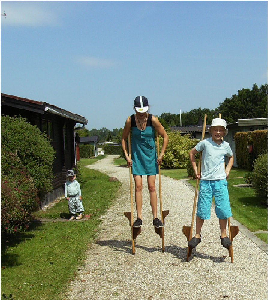
Styltegang på Blåbær Allé